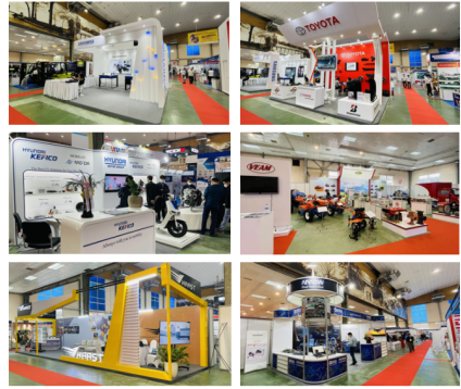
[자료: KOTRA 하노이 무역관]

산업무역부의 2020년 10월 통계에 따르면 베트남에는 2,000여 개의 부품 생산업체가 있으며, 이 중 300개는 다국적 기업이다. 자동차 산업의 경우 베트남의 시장규모는 태국의 1/3, 인도네시아의 1/4에 불과하기 때문에 대부분의 부품을 수입에 의존하고 있다. 그러나 제조업 부품 수입 비율이 높으면 완성품의 가격이 상승하고, 경쟁력이 낮아지게 되므로 베트남 정부는 궁극적으로 모든 제조업 분야에서 부품 조달의 현지화 비율을 높이고자 한다. 이에 따라 베트남 정부는 2020년 8월 6일자로 베트남의 산업 발전을 지원하기 위한 지원산업(Supporting Industry) 관련 결의안을 발행한 바 있다. 결의안에 따르면 2025년까지 베트남은 국내 생산 및 소비에 필요한 필수 수요의 45%를 충족하고 전체 산업 생산가치의 11%를 차지하는 경쟁력 있는 지원산업 관련 다국적 기업 및 국내기업 총 1000개를 육성하고 이중 베트남 현지기업이 차지하는 비율을 30%까지 증대하는 목표를 세웠으며, 2030년까지 국내 생산 및 소비에 필요한 필수 수요의 70%를 국내에서 충족하고, 전체 산업 생산가치의 14%를 차지하는 경쟁력 있는 지원산업 관련 다국적 기업 및 국내기업 총 2000개를 육성하고자 한다. 이 결의안에 의거해 베트남이 지원산업(Supporting Industry)으로 정의한 분야는 섬유산업, 신발산업, 전자산업, 자동차 및 부품 조립·생산업, 기계 제조업 및 하이테크 산업의 6개 분야가 있다.